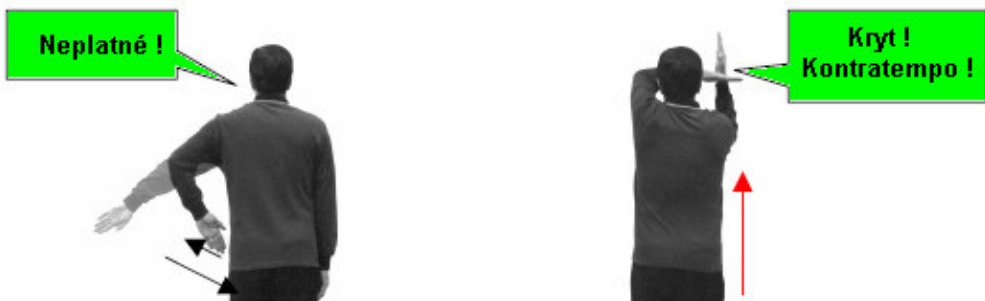
Neplatný zásah šermíře vlevo od rozhodčího