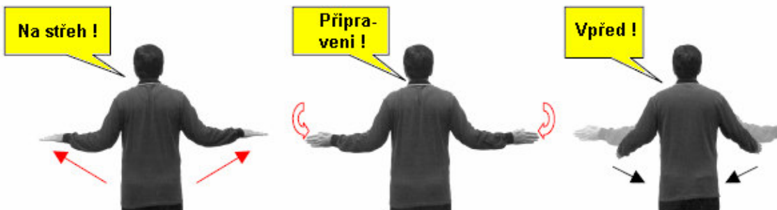
Výzva pro šermíře k zaujetí pozice "Střeh"