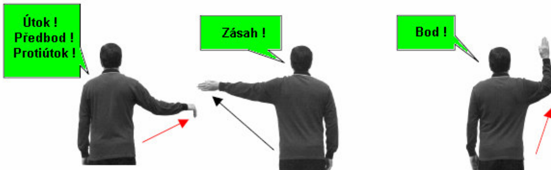
Útok nebo předbod (protiútok) šermíře vpravo od rozhodčího